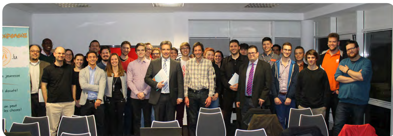
TABLE RONDE „WAHLRECHT MAT 16“